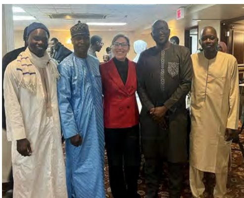
Un moment inoubliable partagé lors d'un Iftar avec la communauté Mourides en Outaouais.

Grâce à un investissement de plus de 5 M$ de notre gouvernement, par le biais de l'Initiative pour la création rapide de logements, nous avons inauguré 26 appartements à Gracefield, qui offriront un refuge à ceux qui en ont le plus besoin : nos aînés, les personnes à faible revenu et celles à mobilité réduite.