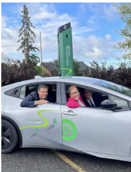
Heureuse d'avoir participé, avec le CREDDO au lancement d'Horizons Partagés, un projet innovant de voitures hybrides en partage, soutenu par notre gouvernement grâce à une subvention de 500 000 $ du Fonds municipal vert de la Fédération canadienne des municipalités.